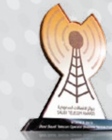
لقاء المحترفين مع خبراء فريق ITC أفضل مشغل اتصالات سعودي لعام ٢٠١٢ (مزرود قطاع الأعمال)

تعرف على الجودة في خدمات شركة الاتصالات المتكاملة ITC لخدمات قطاع الأعمال وتجارب عملاء ITC واكتشف النجاح في تميز الخدمات التي تقدمها شركة الاتصالات المتكاملة لكل قطاع من قطاعات الأعمال. صنفت شركة الاتصالات المتكاملة ITC كأفضل مشغل اتصالات سعودي لعام ٢٠١٢ (مزرود قطاع الأعمال) عبر مجموعة من الخبراء المحليين والعالميين في تيلسا ٢٠١٢.